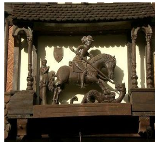
St Georges et le dragon