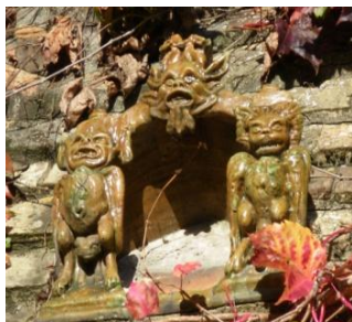
Terre cuite vernissée