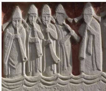
Décors reproduits de l'abbaye de Boscherville