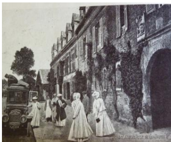
Carte postale ancienne