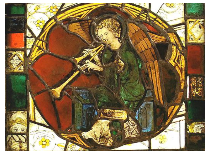
Ange jouant du chalumeau double 1

Outre leur incroyable beauté, les vitraux présentent également un intérêt particulier pour l'histoire de la musique permettant une meilleure connaissance des instruments de l'époque. On retrouve illustrés divers instruments : guiterne à 3 cordes, orgue positif, claque-bois, viole à archet, hautbois, chalumeau double, syrinx ou flûte de pan et cornemuse.