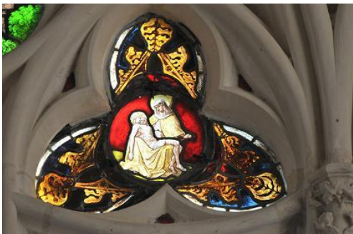
Les trilobes datent également du 14 ème siècle 1

Quelques éléments de vitraux de l'église Notre Dame, situés dans la grande verrière, datent eux aussi du 14 ème siècle. Ils figurent les scènes de la création d'Eve, la tentation, l'expulsion du jardin d'Eden.