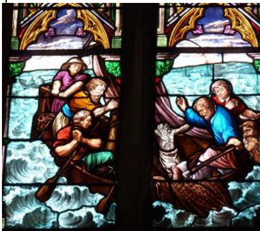
La pêche du Christ miraculeux

Ces éléments ont été intégrés dans le vitrail actuellement en place et qui a été réalisé au 19 ème siècle par l'artisan peintre verrier Duhamel-Marette. Celui-ci a également réalisé plusieurs vitraux de l'église de Dives : la vie de Saint Pierre, de Saint Jean-Baptiste, ... Un de ces vitraux décrit la légende du Christ Saint-Sauveur, à l'origine du pèlerinage de Dives sur mer qui a duré plusieurs siècles.