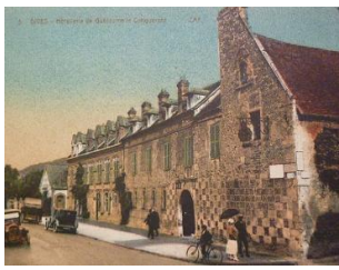
Façade rue d'Hastings