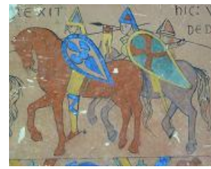
Décor tapisserie de Bayeux