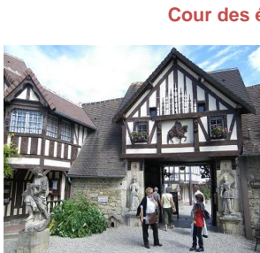
Cour des évangélistes